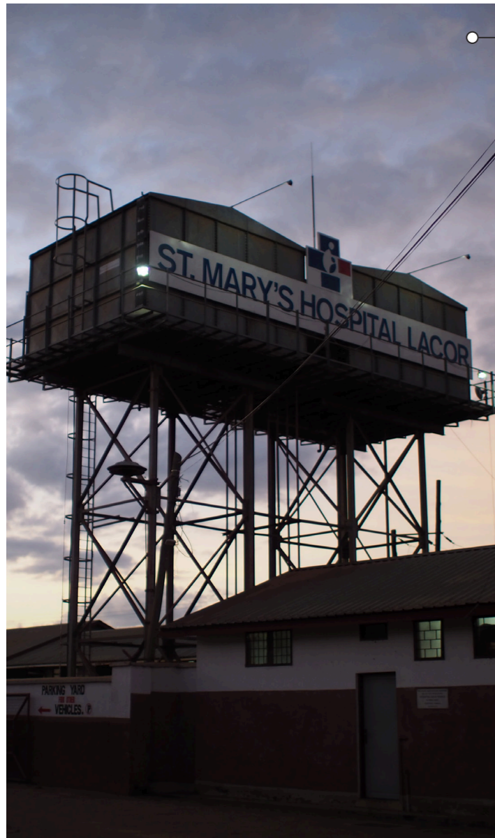
Esterno del st. Mary's hospital Lacor

Ogni intervento è orientato a migliorare in modo tangibile la qualità della vita delle persone svantaggiate, contribuendo a restituire fiducia, speranza e nuove prospettive per il futuro.