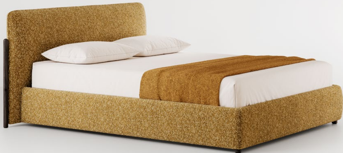
Flag family complements

Fabric: Louvre 11, cat. Extra Wooden parts: Wenge