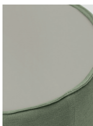
laccato ral / ral laquered