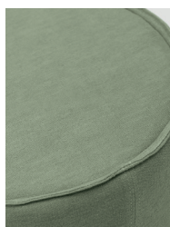
tessuto coordinato / coordinated fabric