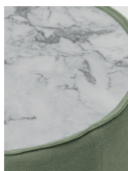
marmo / marble