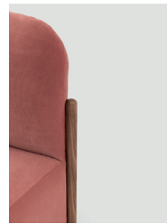
gamba base basic leg