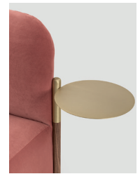
tappo + vassoio cap + tray